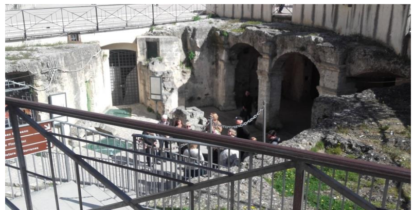
Particolare della citta' sotterranea