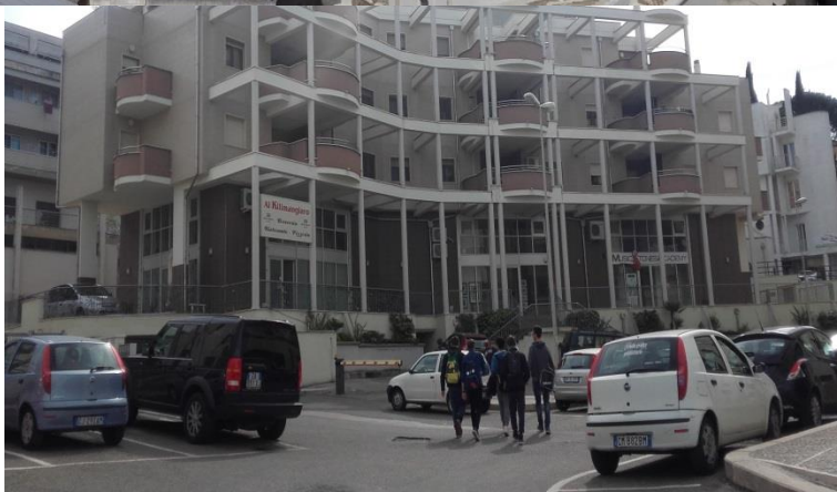
Siamo arrivati in pizzeria