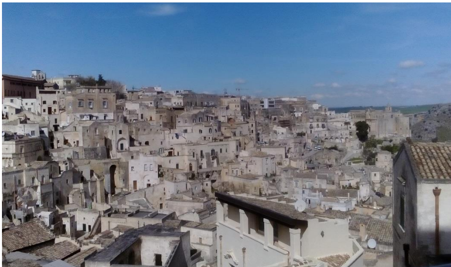
Panorama dalla citta'