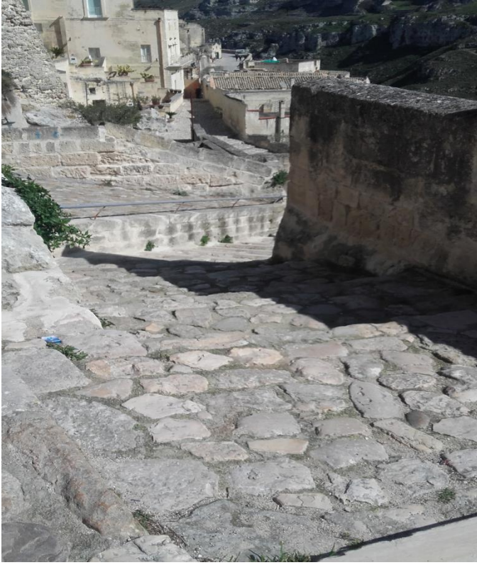
Citta' in miniatura