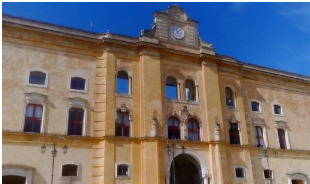
Felici di essere a Matera