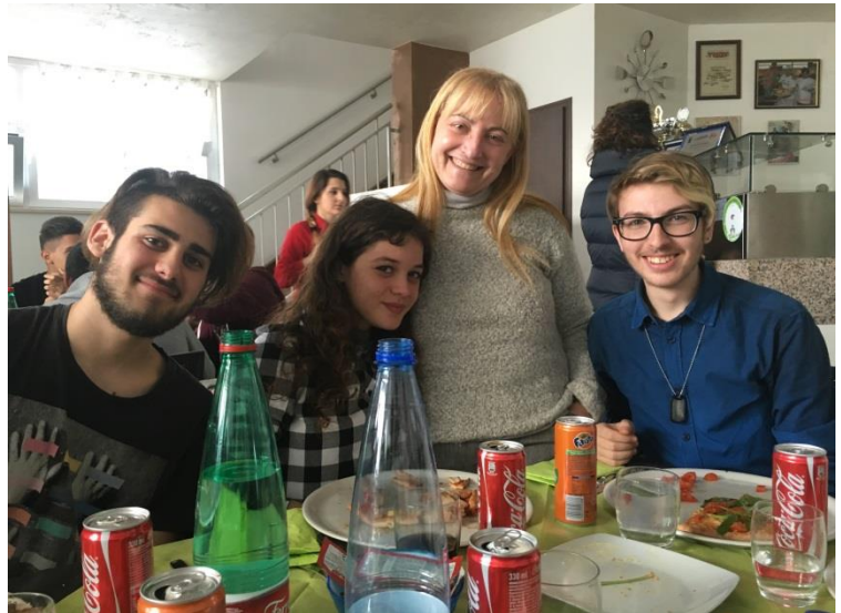
Felici di esserci