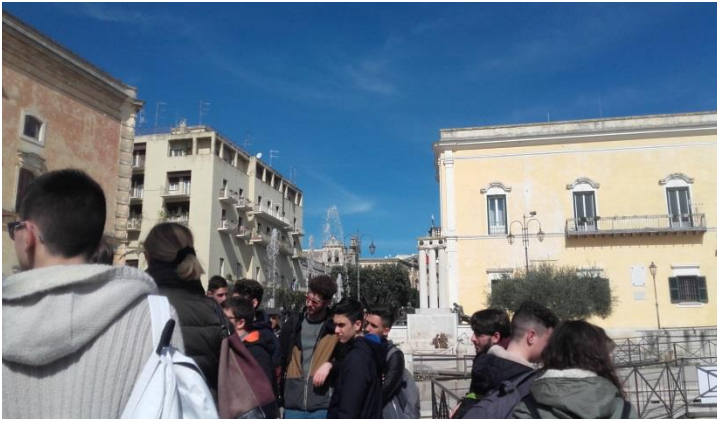
...Ascoltando la guida