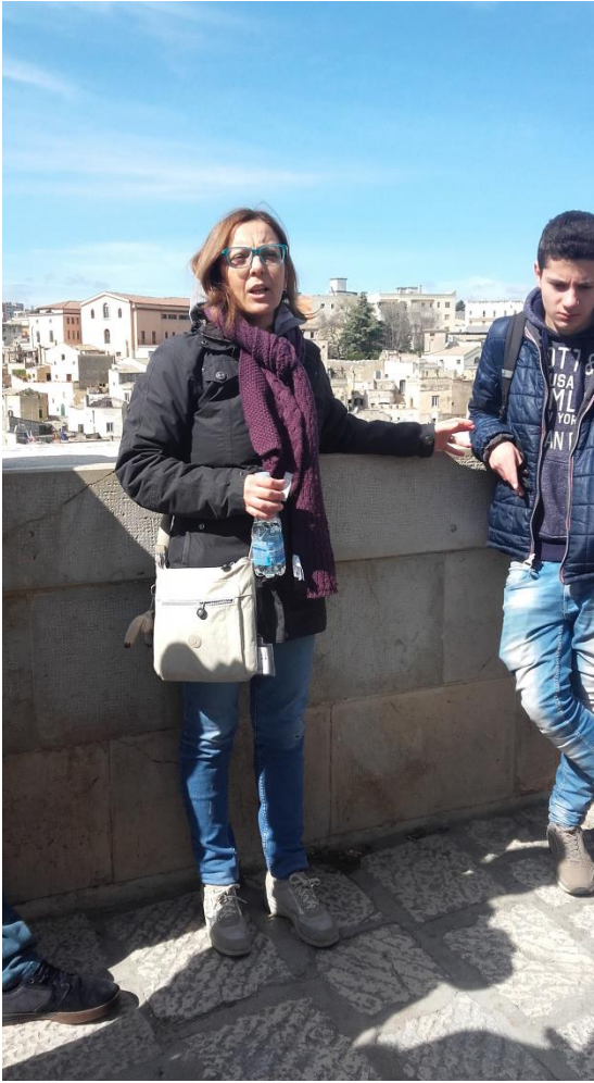
Liuni attento alla voce della guida