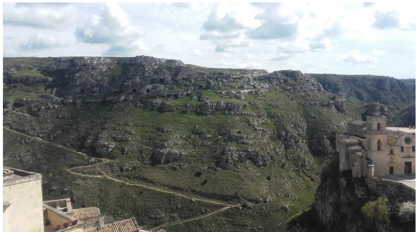
Particolare del Sasso materano