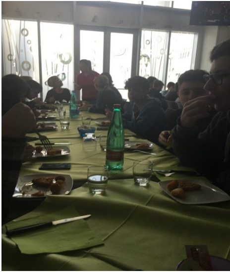
Finalmente si pranza