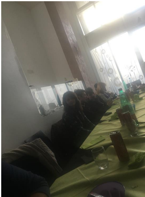
Tutti a tavola