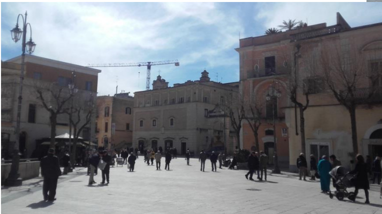
Piazza del centro