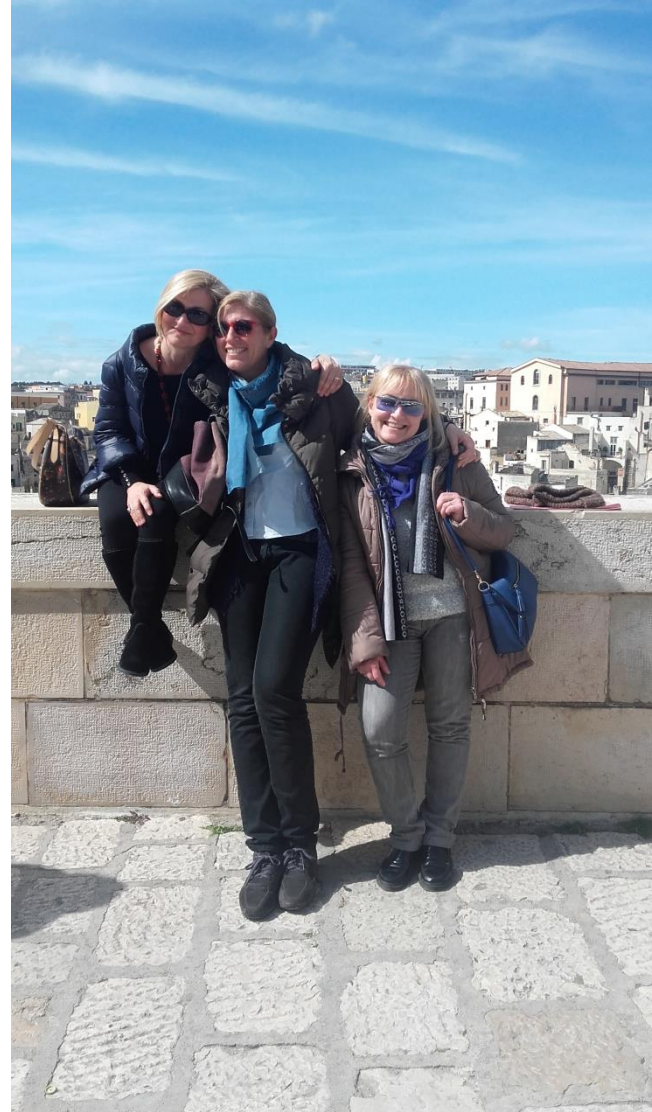
Le tre colonne