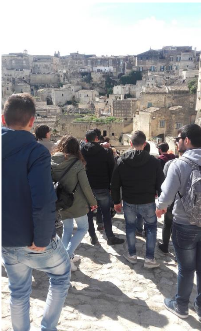
In cammino verso i sassi