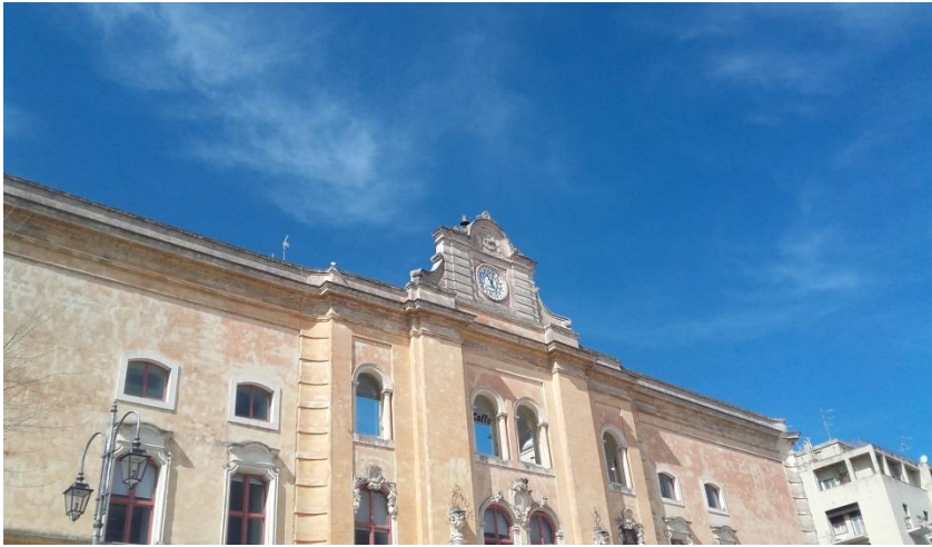
Centro storico di Matera