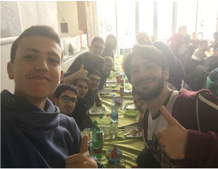
Sulla via del ritorno