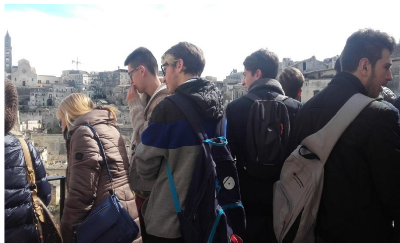
Guardando il panorama